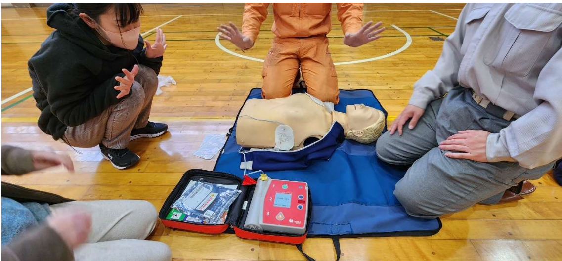
↑教職員によるAED講習が行われております。