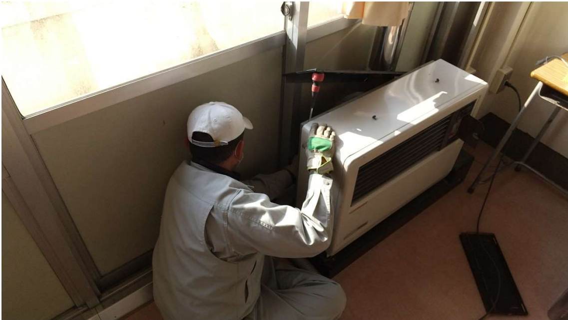
↑事務部の職員が学び舎の環境整備に汗を流しております。