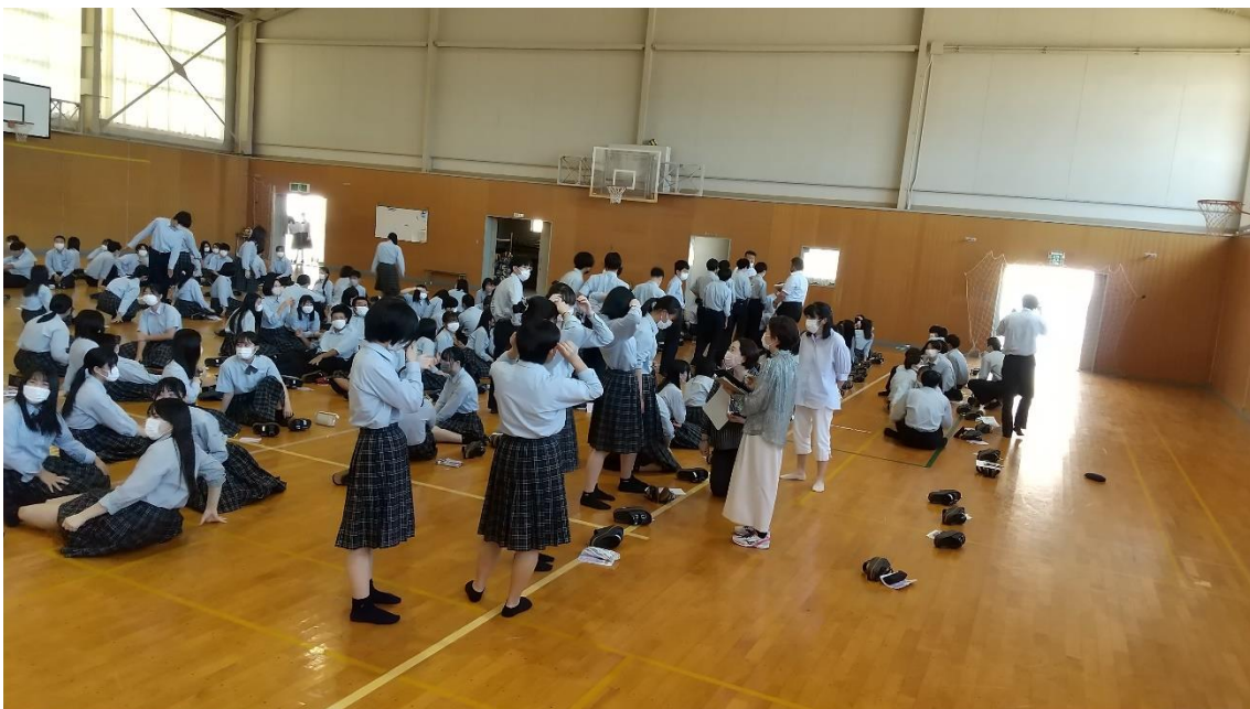
↑身だしなみの確認