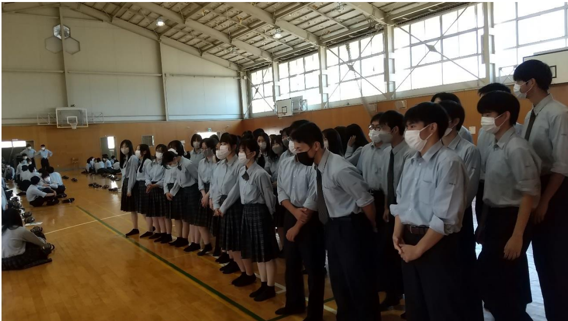
↑クラス写真撮影時の位置を確認