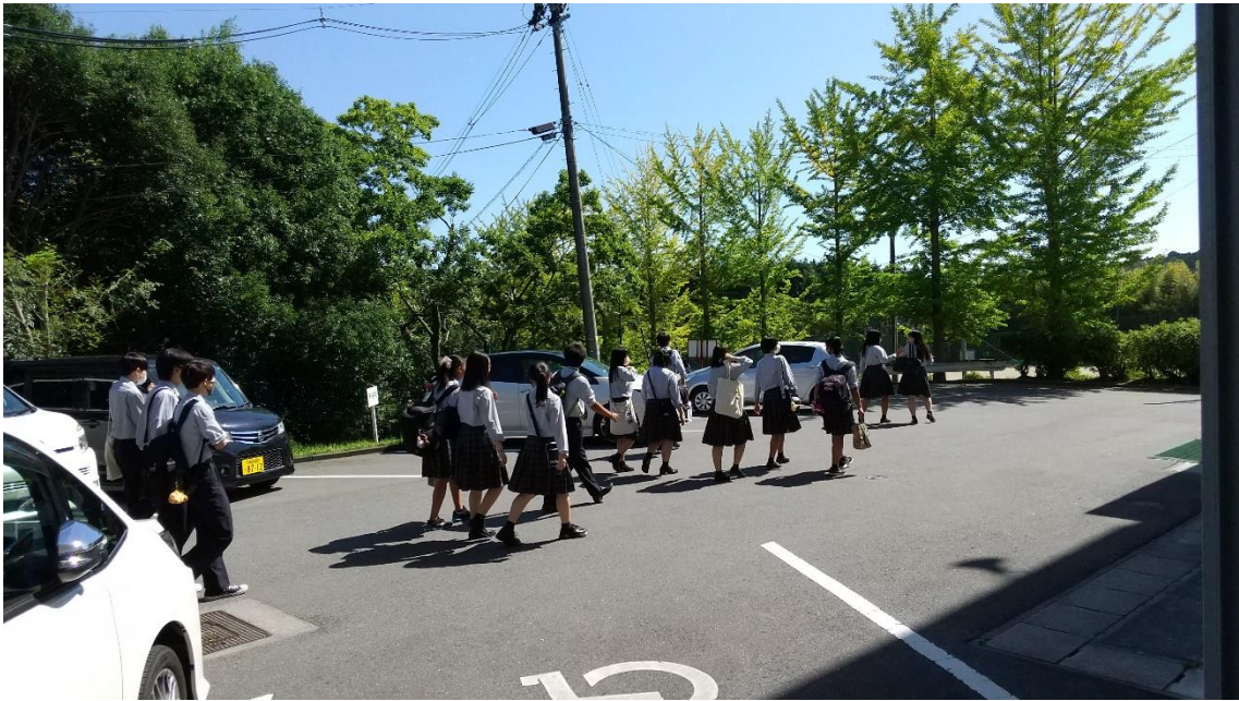
↑ 明日に備えて、早めに放課