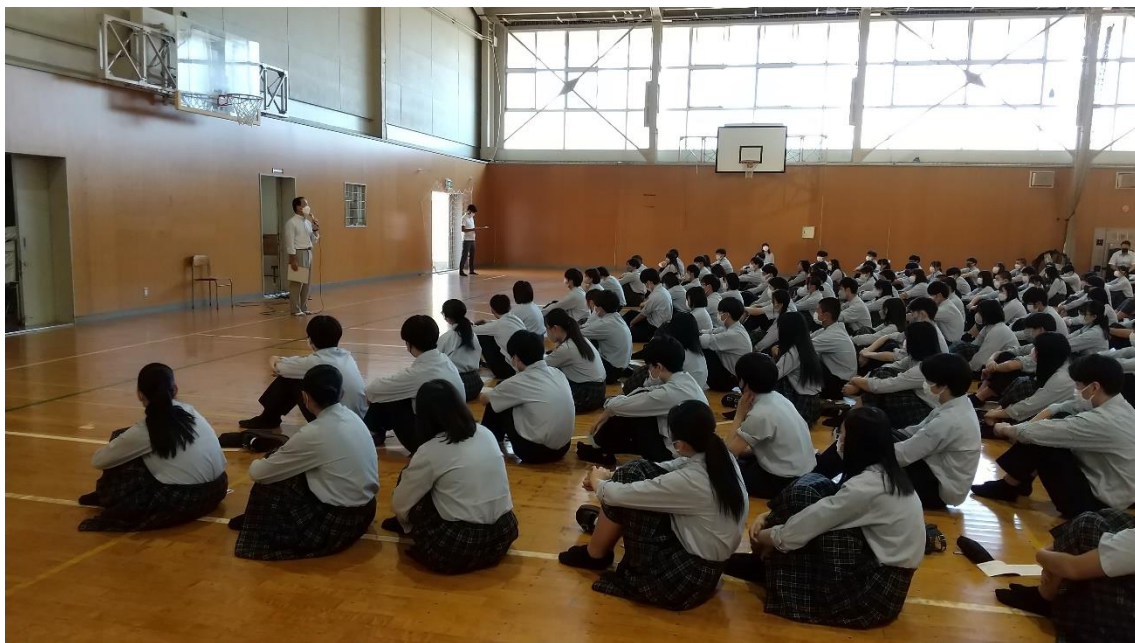
↑学年主任から修学旅行の心得

今日2・3校時は結団式。備えあれば憂いなし！修学旅行に向けて、さまざまな確認をしました。