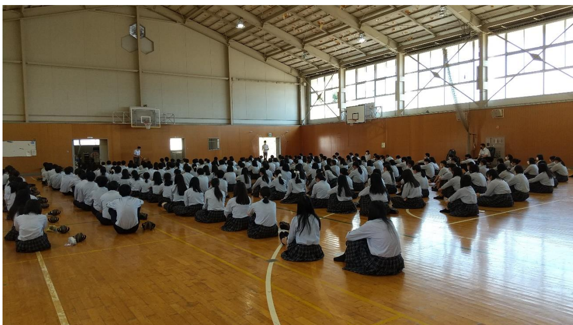
↑団体行動では時間を守ることが大事！